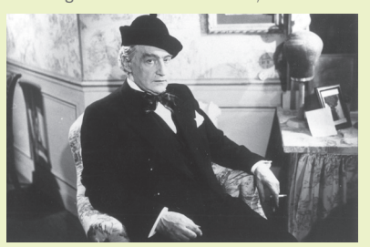
Sacha Guitry in La Comédie

L'eleganza, l'umorismo e lo stile di Sacha Guitry, autore teatrale di successo che si fa "rapire" dal cinema, rifugioso in Bonne chance! (1935), rievocazione personale e delicatamente cinica di un lubitschiano design for living , La Malibran (1943) e Aux deux colombes (1949), commedie di acuminata leggerezza, di restroguo amaro. Più tardi, La vie d'un