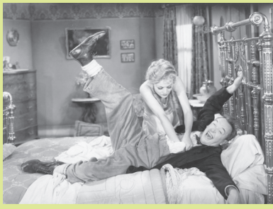
Way Out West

titoli presentati, rarità di grandi cineasti europei e americani. Als ich lot war , Ernst Lubitsch 1916. Dynamite , Cecil B. DeMille 1929. Madame de Thébes , Mauritz Stiller 1915. Dall'Italia, i restauri dell' Inferno della Milano (1911), primo lungometraggio e primo compiuto "adattamento" dantesco del cinema italiano, e di Maciste imperatore (Guido Brignone, 1924). Tra la ventina di Ritrovati e Restaurati sono, presentati al Cinema Arlecchino e alla sala Lumière 2, Allegri vagabondi (1937) con Stanlio e Olio e L'armata degli eroi di Jean-Pierre Melville, intensa rievocazione degli anni sanguinosi dell'occupazione nazista in Francia, grande, aspro noir sulla memoria e sull'inevitabile inganno della vita. Sarà ancora Ben Gazzara a presentarli il proprio elettrizzante esordio in The Strange One , primo film di John Garfield.