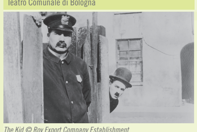
The Kid / Roy Export Company Establishment

Partitura orchestrale composta da Charles Chaplin e diretta dal Maestro Timothy Brock, eseguita dall'Orchestra del Teatro Comunale di Bologna